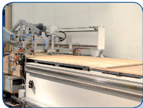
Podajnik jedno lub wielopłytyowy