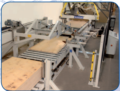
Załadunek ze stosu płyt