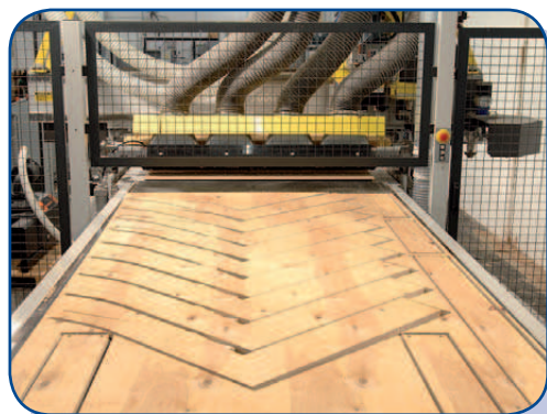
Elementy do rozładunku