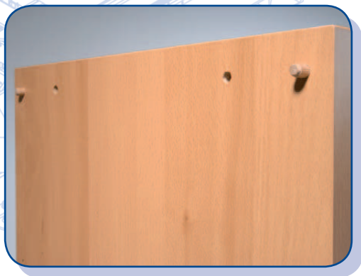
połączenia kołkowe w układzie 32 mm

Żaden korpus nie jest zbyt skomplikowany